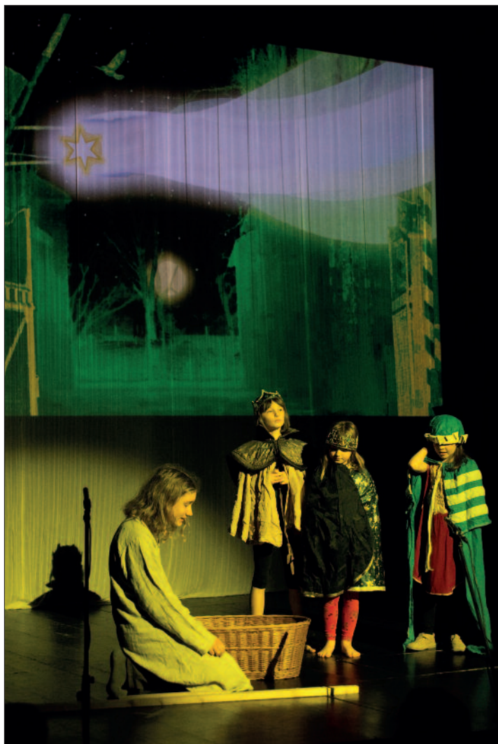
Podivuhodné království

Sborový dopis vršovického sboru Českobratrské církve evangelické