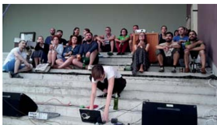
Letní kino našeho filmového klubu na schodech spřáteleného rkc kostela sv. Václava.