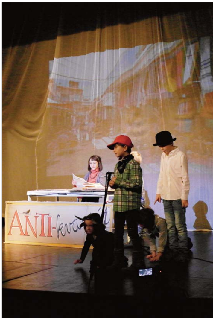
Vánoční krimi apokryf

Sborový dopis vršovického sboru Českobratrské církve evangelické