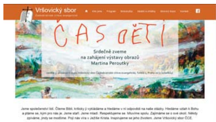
Nový web Vršovického sboru