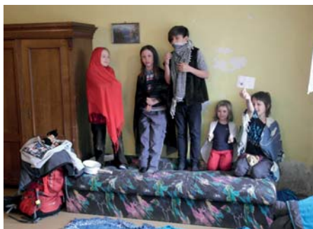
Polovikendovka s dětmi a rodiči 22. dubna 2017 v Úštěku