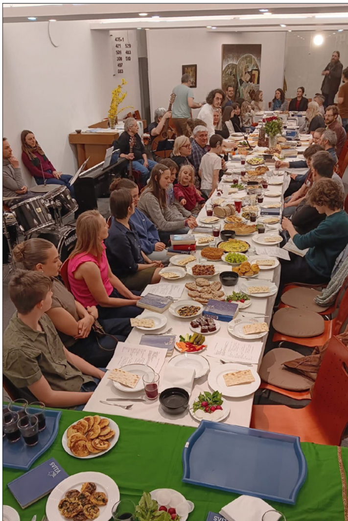
zelenočvrteční bohoslužba

Sborový dopis vršovického sboru Českobratrské církve evangelické