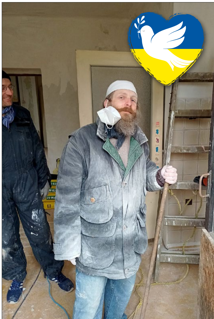
Momentka z brigády ve Zru i n.S.

Velikonoční zármutek i radost, nejistota i ujištění, odchod i příchod (2)