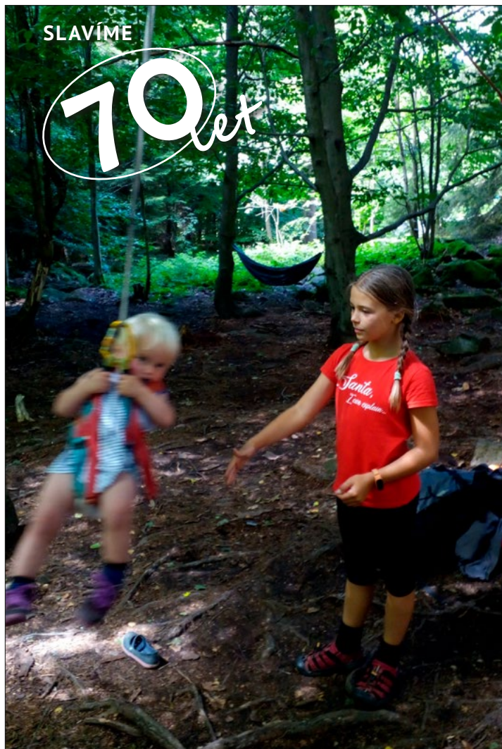
Sborová dovolená

Sborový dopis vršovického sboru Českobratrské církve evangelické