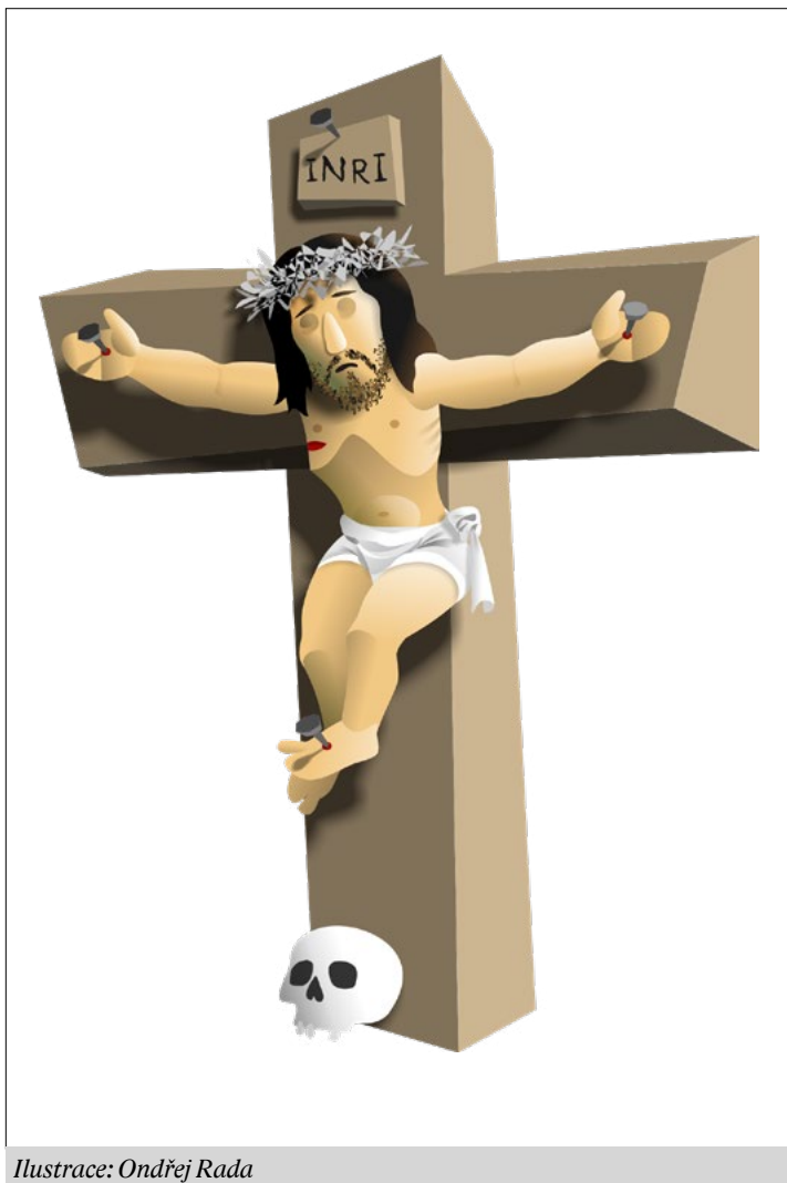
Ilustrace: Ondřej Rada

Milí přátelé, přinášíme vám velikonoční speciál Sborového dopisu Katakomby. Tedy zejména program, jak můžete letos slavit velikonoční svátky. Pevně věříme, že nám pomůže najít a prožít velikonoční radost, kterou přinesl Ježíš z Nazaretu velikonočně vzkříšený.