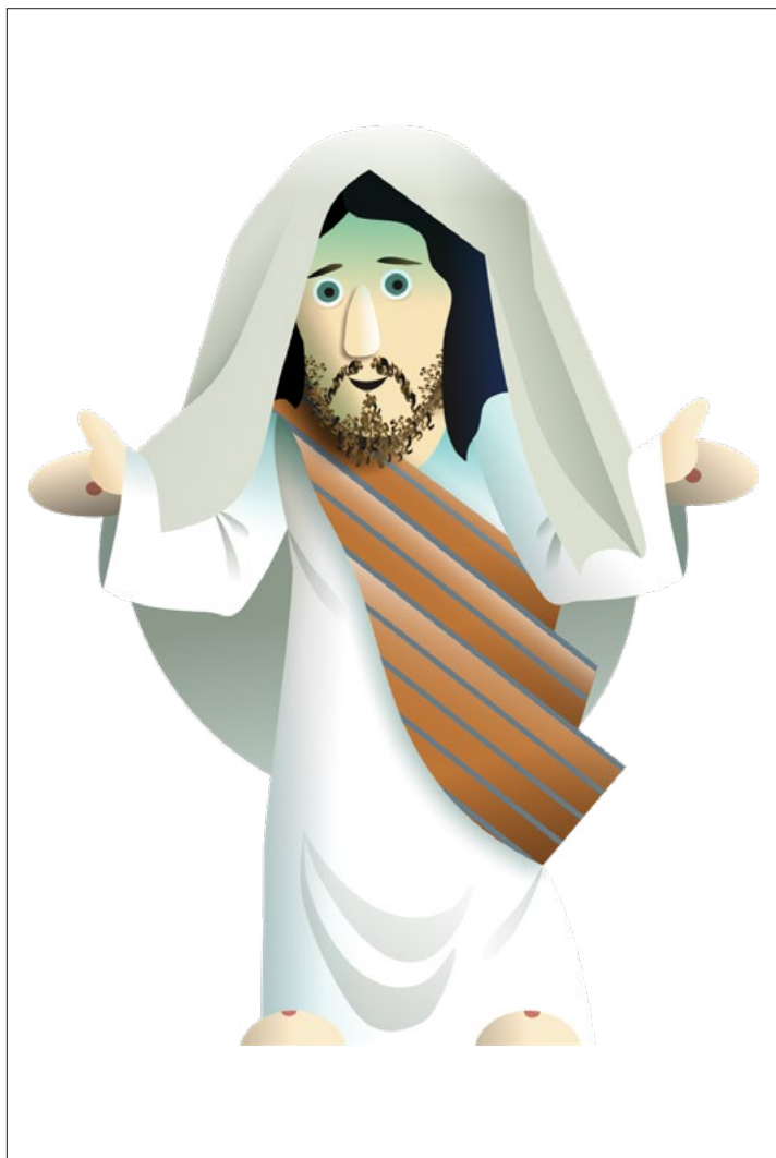
Vzkříšený Ježíš (ilustrace: Ondřej Rada)