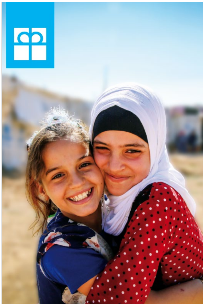
Vzdělání pro děti v Libanonu ( www.postnisbirka.cz )

Sborový dopis vršovického sboru Českobratrské církve evangelické