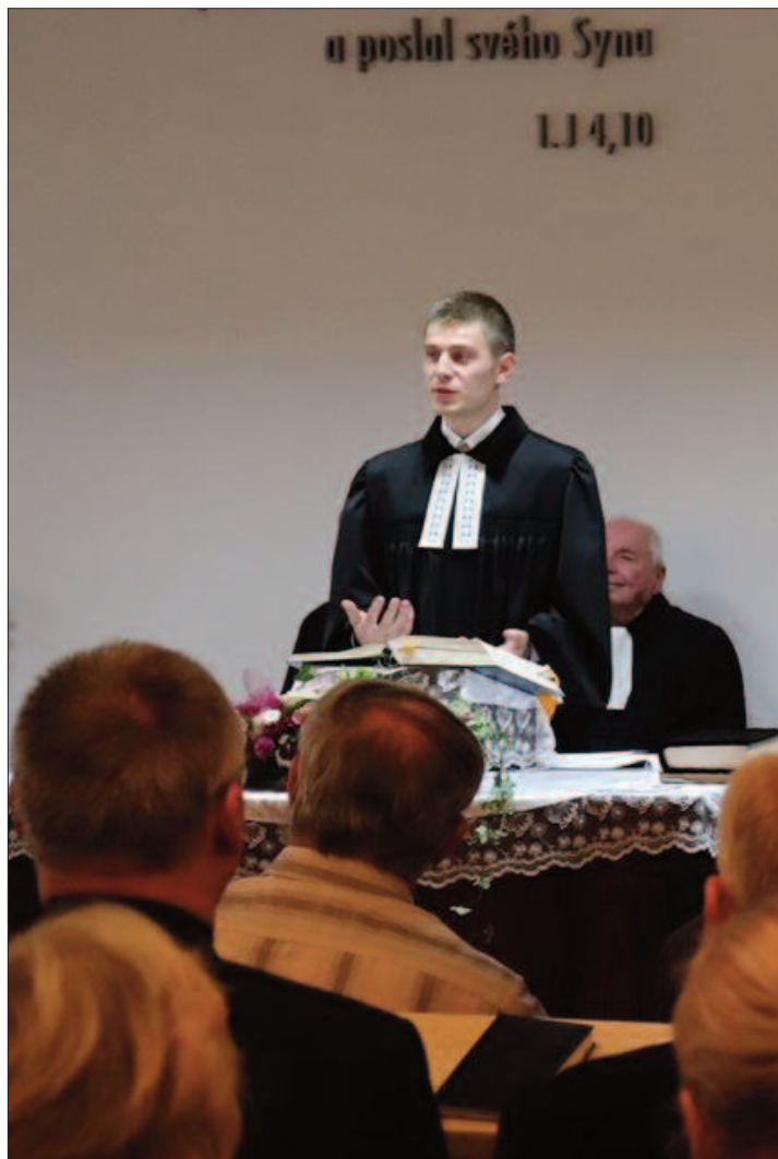
Instalace Aleše Rosického v Teplé u Mar. Lázní

Sborový dopis vršovického sboru Českobratrské církve evangelické