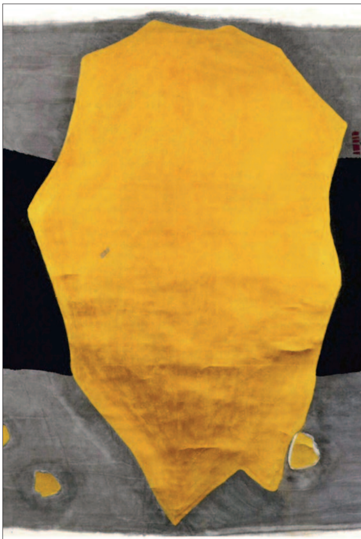
Dao Zi v: Bůh a zlato – Kolik je dost?