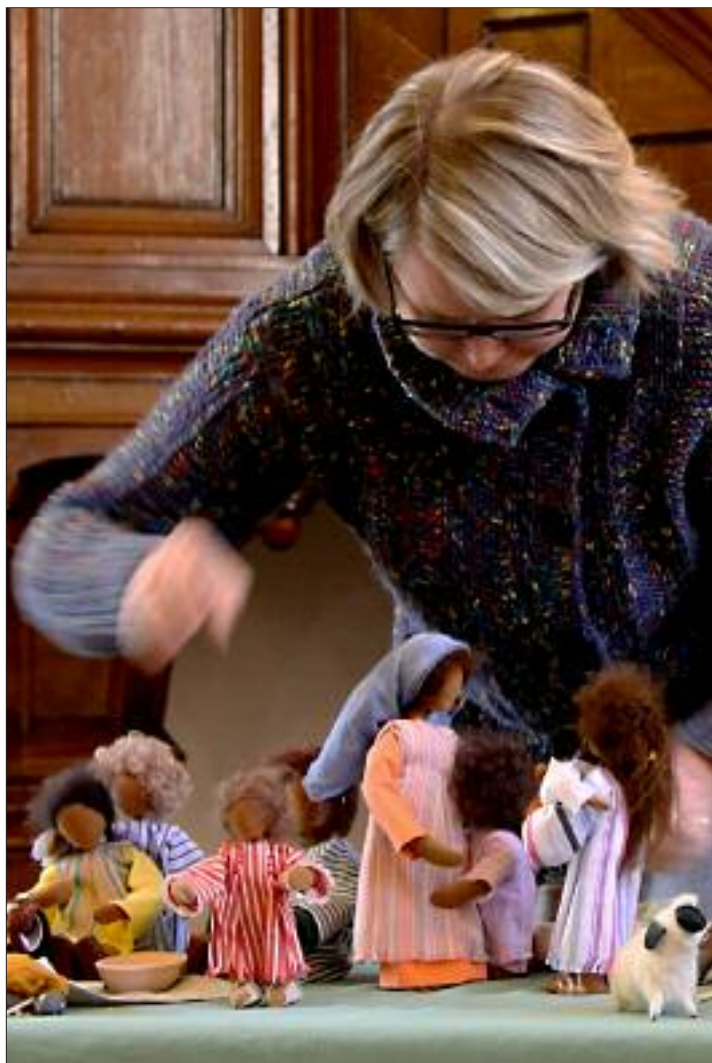
Biblické figurky

Sborový dopis vršovického sboru Českobratrské církve evangelické