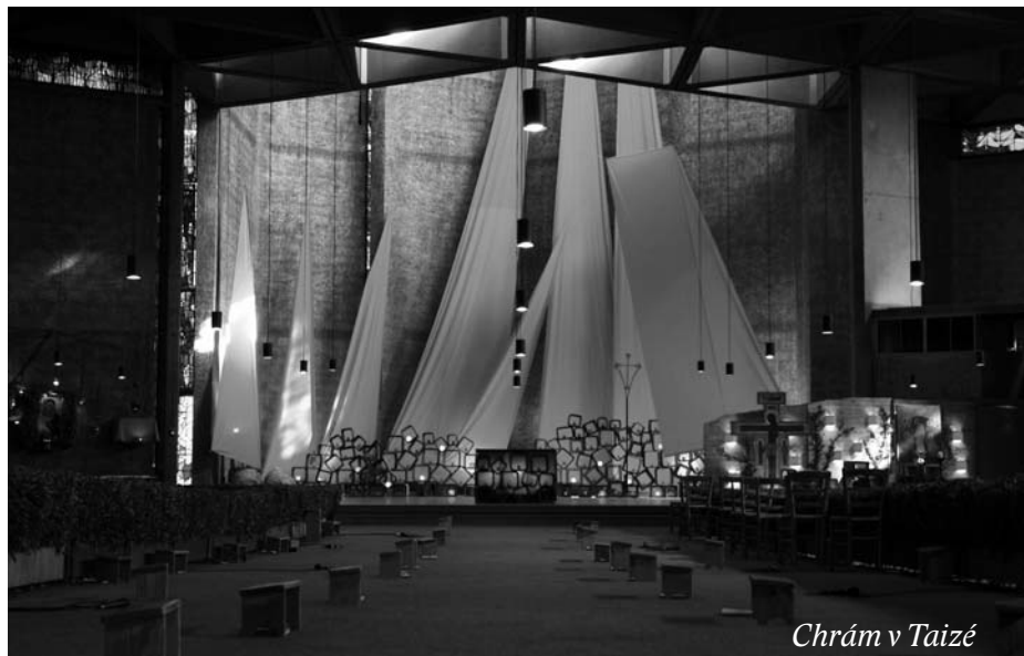
Chrám v Taizé