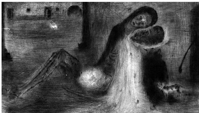
Bohuslav Reynek: Pieta na dvoře

Tma. Z tmy se rozední. Zítří – už za chvíli. Snad zrno vyklíčí. Klíč v zámku zakvílí.