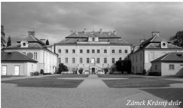
Zámek Krásný dvůr

„tatíček“ nebyl politikem současného typu, neustále hájícím nějaké vlastní či kolektivní zájmy, nýbrž mužem myšlenky, která si hledá cestu ke kultivační proměně společnosti. Pak nás přivítá obec Kryry , která prý byla milá už lovcům mamutů a po nich i slovanským Lučanům. Z temnot bájí