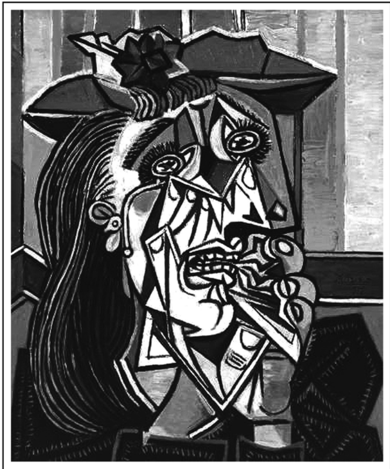
● Pablo Picasso - „Plačící žena“, 1937 ●

Sborový dopis Vršovického sboru Českobratrské církve evangelické