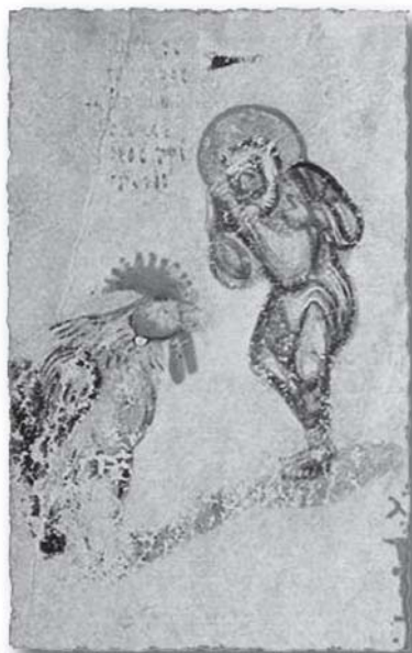
Sv. Petr s kohoutem miniatura z Chludovského žaltáře, 9. století