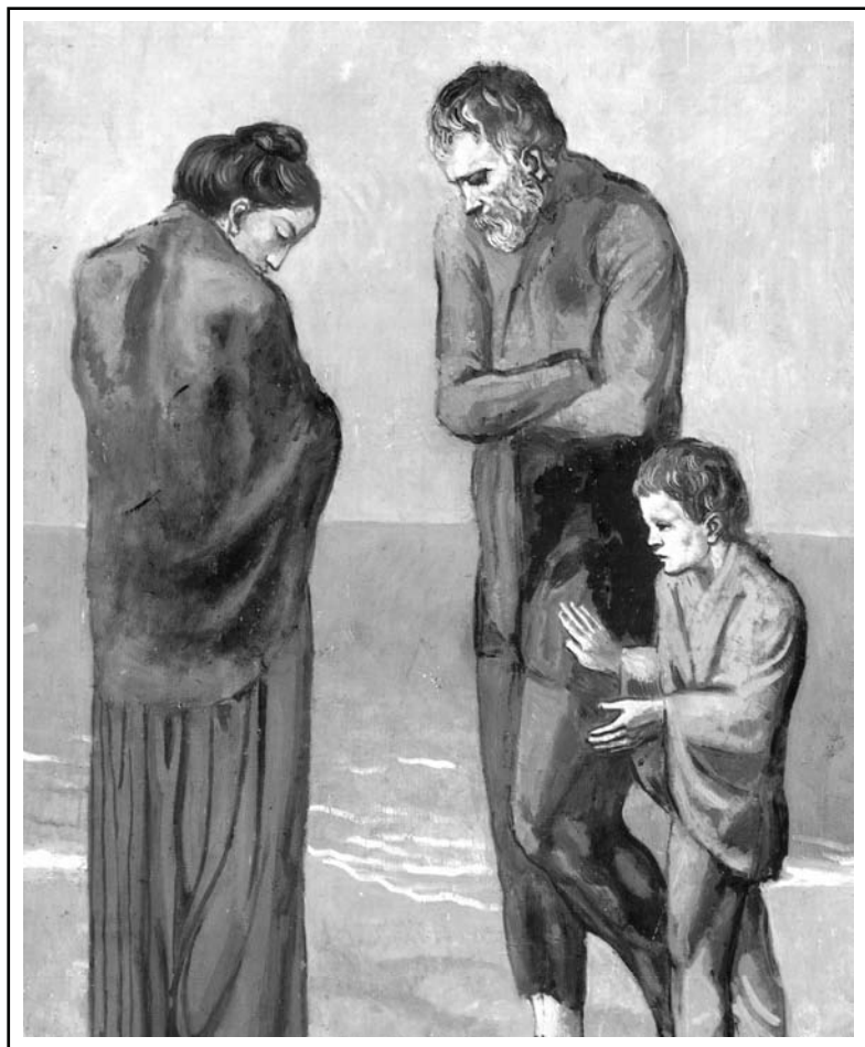
● Pablo Picasso: „Chudáci na břehu moře“, 1903 - detail ●

Sborový dopis Vršovického sboru Českobratrské církve evangelické