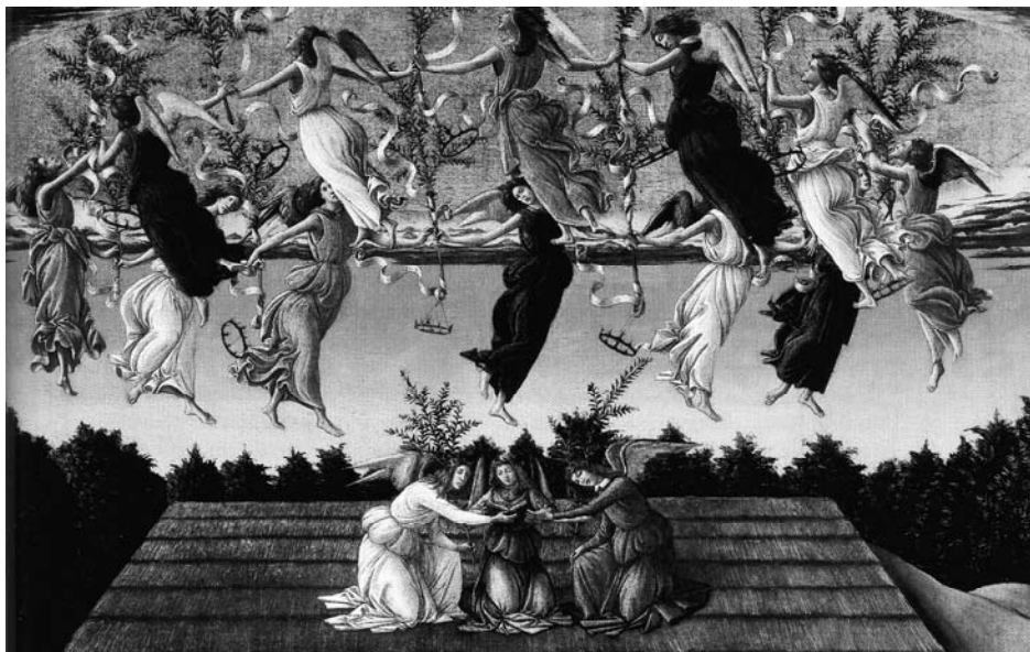
Sandro Botticelli: „Mystické narození Páně“ - detail, r.1500

na vánoční (i velikonoční) „Aninčiny perníčky“, které se mně i členům naší rodiny zdají být nejlepší ze všech, které jsme dosud měli možnost ochutnat. Recept na tyto perníčky mi kdysi poslala manželova sestřenice Aninka s doporučením, že u jejich vnoučat jsou velice žádané a že i našim klukům jistě budou chutnat. A měla pravdu. Od té doby je každý rok pečou; jsou výborné jak křupavé, ponechají-li se v uzavřené krabici, tak nechají-li se na vzduchu změkknout. Ozdobené perníčky jsou krásné na svátečním stole i na vánočním stromku.