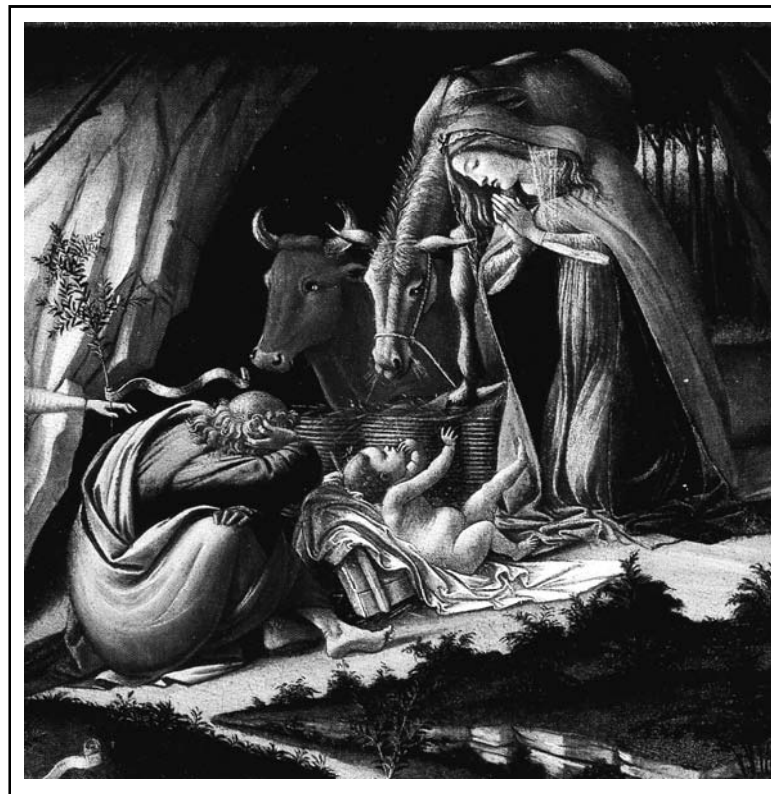
● Sandro Botticelli: „Mystické narození Páně“ - detail, r. 1500 ●

Sborový dopis Vršovického sboru Českobratrské církve evangelické