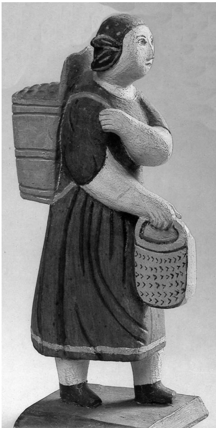
Všechny reprodukce v tomto dopise (kromě „Vendelína“) čerpají z lidové betlemářské tradice a řemesel 19. století v Čechách a na Slovensku