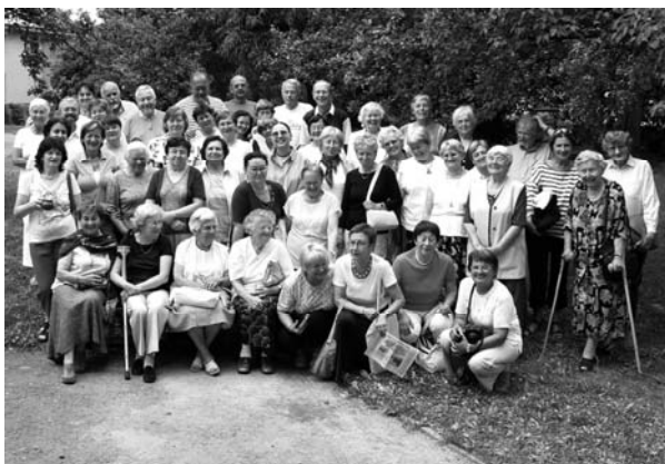
Společné foto většiny účastníků ESBU 2006