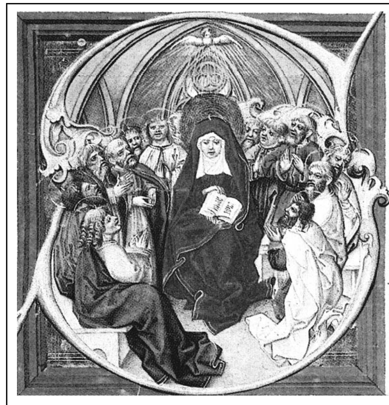
● Lobkovický graduál - iniciála „S“ s motivem „Seslání Ducha sv.“ (kolem r.1500) ●

Sborový dopis Vršovického sboru Českobratrské církve evangelické