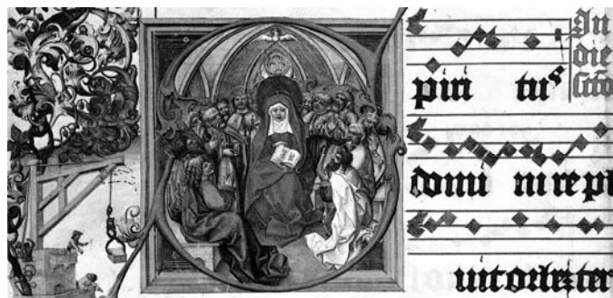
Lobkovický graduál - inícia „S“ s motivem „Seslání Ducha sv.“ (kolem r.1500)