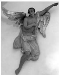
Sponzor SD Katakomby:

ČESKOSLOVENSKÝ ČTRNÁCTIDENÍK - CZECHOSLOVAK BI-WEEKLY