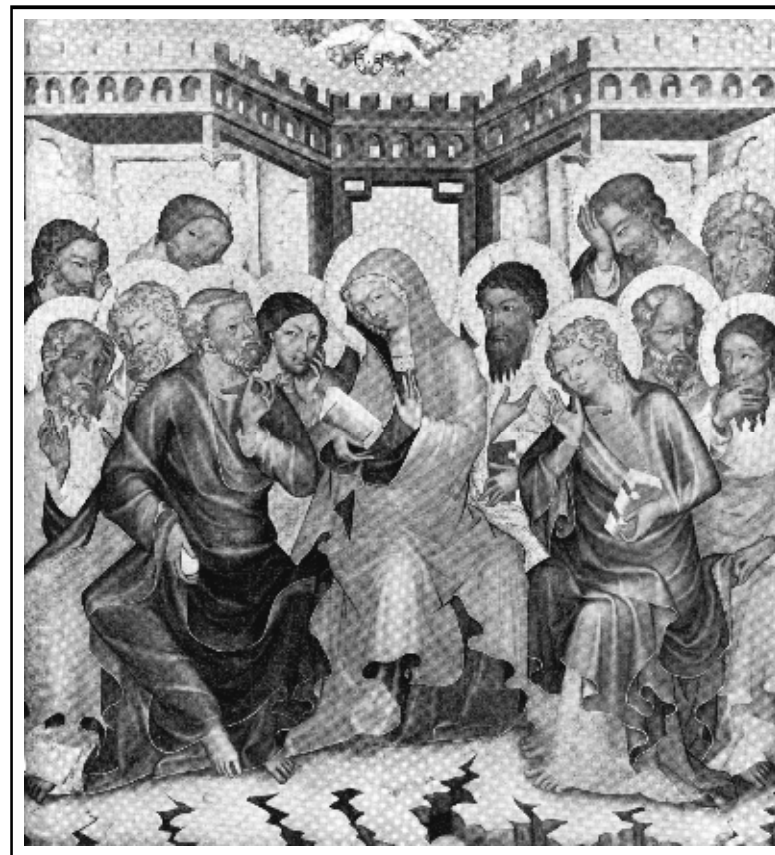
● Mistr Vyšebrodského oltáře - „Seslání Ducha svatého“ (čtyřicátá léta 14.století) ●

Sborový dopis Vršovického sboru Českobratrské církve evangelické