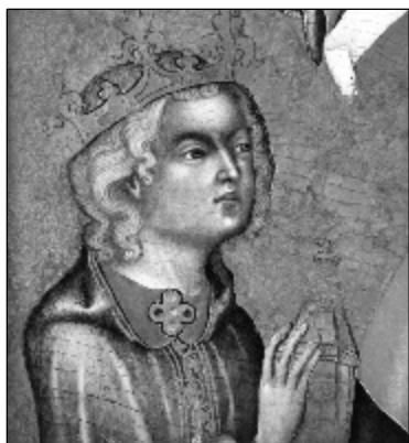
Mistr Vyšebrodského oltáře - Detaily „Klanění tří králů“ (čtyřicátá léta 14. stol.)