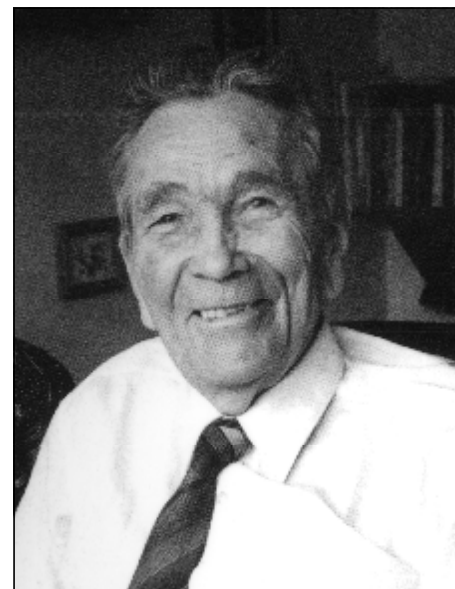
Bratr profesor PhDr. Zdeněk Matějček CSc. (1922 - 2004)

Od této chvíle jsou blahoslaveni mrtví, kteří umírají v Pánu. Ano, praví Duch, ať odpočinou od svých prací, neboť jejich skutky jdou s nimi (Zj 14,13).