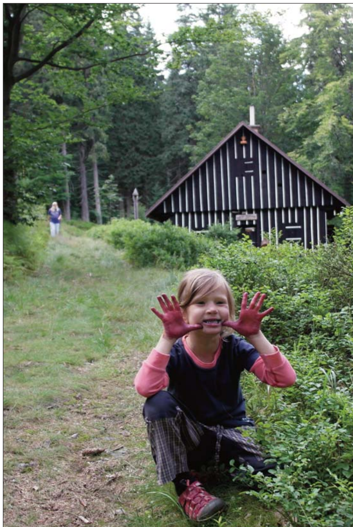
Sbírání borůvek na sborové dovolené

Sborový dopis vršovického sboru Českobratrské církve evangelické