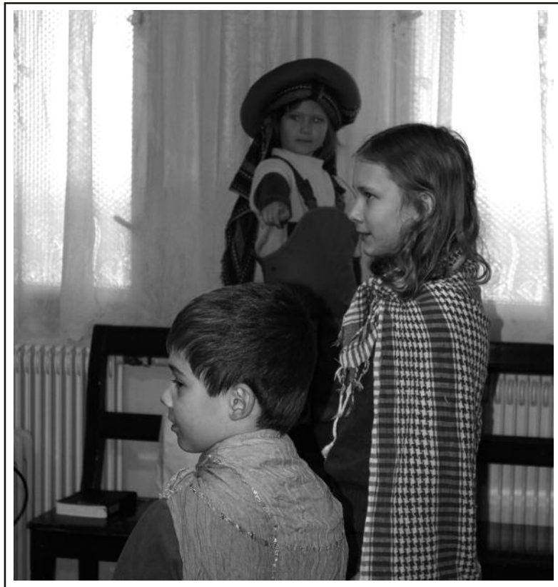
● Polovíkendovka 21. a 22.4. v Úštěku ●

Řeč ozdobená solí (2) • Editorial (3) Kde možno priložiť ruku k dielu alebo sa účastniť (3) • Pozdrav Tomáše Juna (4) • Jak jsem potkal lidi (4) • Den Diakonie (5) • Setkat se nad tématem (další plány filmového klubu) (5) • Bielefeld 2017: Grilování v přátelském duchu (6) • Zkrácený zápis ze staršovstva 27. 4. 2017 (7) • Kam že to jde Cesta ven? Rozhovor s Ondřejem Balíkem, jedním z členů spolku Cesta ven. (9) • Dej, kolik myslíš (10) • Zprávy a pozvánky ČCE (11) • Recept: Mrkvová pomazánka (12)