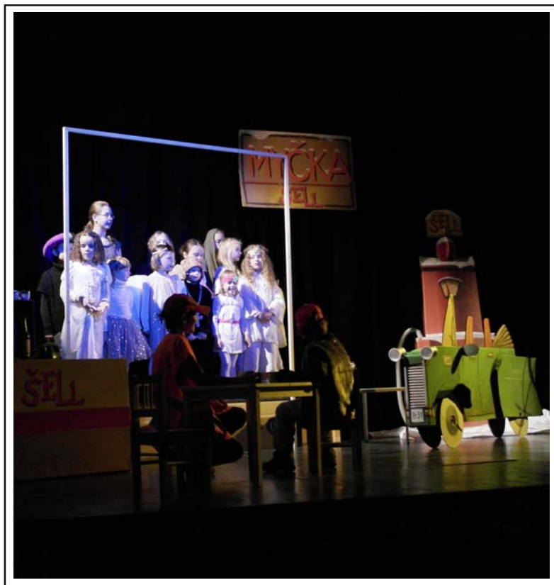
● Vánoční hra Vánoce na pumpě v divadle Mana ●

Novoroční transplantace srdce (2) • Editorial (3) • Maruščino pozvání aneb O jahodách v zimě (3) • Lítá nám to jedna radost (3) • Podzim života podle Hildegardy z Bingen (4) • Sobotní aspik Pavla Vágnera (5) • Zkrácený zápis ze staršovstva 14. 12. 2016 (6) • Zprávy a pozvánky ČCE (9) • Anketa: Stárnu, stárneš, stárneme (9) • Proč si často nerozumíme? (10) • Video z vánoční hry (11) • Recept: Martinské rohlíčky (12)