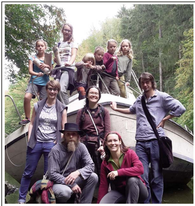
● Polovikendovka s dětmi v Čími 30. 9. – 1. 10. 2016 ●

Byl jednou jeden král (2) • Editorial (3) • Jak se sžívám s Manchesterem (4) • Děkujeme a vítáme (4) • Přijďte, bude nám hejl! (5) • Zkrácený zápis ze staršovstva 22. 9. 2016 (5) • 20 let v Tulské / Jů, já, hele... nebo též: První dojmy (8) • Zprávy a pozvánky ČCE (9) • Nové trivium? (10) • Recept: Mexická polévka (12)