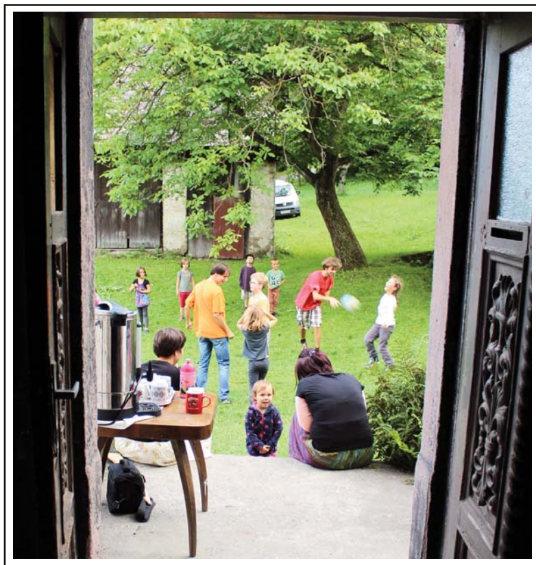
● Letní tábor v Křížlicích ●

Daleko je Hospodin (2) • Editorial (3) • Pravidelný sborový program – kdy kde co? (3) • Zářijové Horoušánky (3) • Lesní jahody aneb vzpomínka na léto (4) • Náměstí Svatopluka Čecha se opět vzbudí z polospánku (5) • Zkrácený zápis ze staršovstva 23. 6. 2016 (6) • Od potopy k potopě (8) • Pozvánky a zprávy ČCE (9) • S knížkou v ruce (11) • Recept: Apfel-Püfferchen (12)