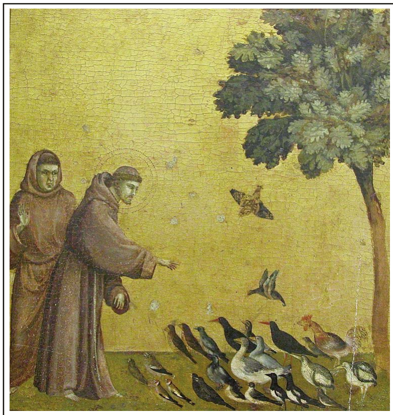
● Giotto di Bondone (1295–1300) Sv. František káže ptákům (Paříž, Louvre) ●

Pohrdat tělem? (2) • Editorial (3) • Rozloučení Evy Boškové (3) • Hroušánky OPEN 2016 (4) • Saláry a Jeronymova jednota (4) • Zkrácený zápis ze staršovstva 28. 4. 2016 (5) • Poohliadnutie za dňom zeme (8) • Relativismus – riziko, nebo výzva? (11) • Recept: Zdravá pohanka (12)