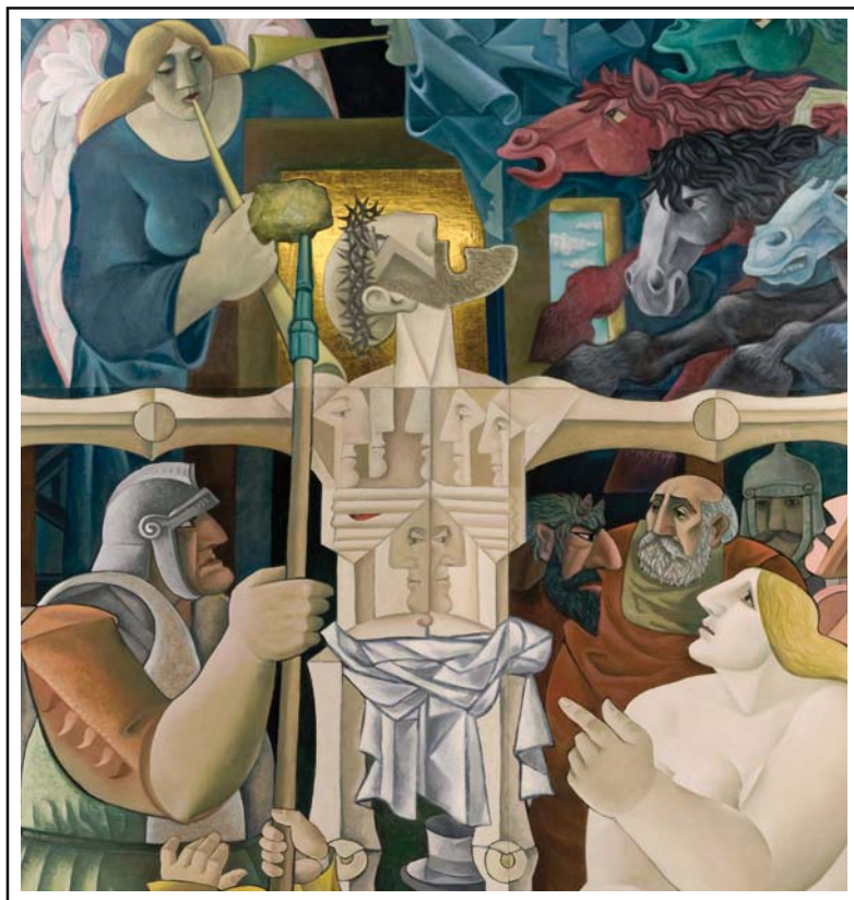
● Miroslav Rada: Velké Pašije (detail) ●

Slovo pro postní čas roku 2016 (2) • Editoriál (2) • Tak jde čas: Hřivny a kroupy (3) VOLNO! (3) Vzkazy od konfirmandů (4) Pololetky ve Strážném (4) Vršovická omladina (5) Milé sestry a milí bratři (5) • Farářovo přemítání nad uplynulým rokem, a taky trochu statistiky (6) • Zpráva o příjmech sboru – salár (8) • Sbirka na Jeronymovu jednotu (8) • Zápis ze schůze staršovstva dne 4. 2. 2016 (9) • Výkaz hospodaření za rok 2016 a předběžný rozpočet na rok 2016 (12) • Pozvánky ČCE (13) • Chvála tázání (14) • Nedovedu tě vysvětlit (15) • Za lepším zítřkem (15) • Recept: Gratinovaná petržel se smetanou a hořčicí (16)