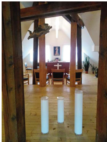
Kaple vršovického záměčku, kde nově každý měsíc probíhají ekumenické bohoslužby

Heslo měsíce června nás zavádí k příběhu „úskočného“ Jákoba. Přesně na konec jeho úskočnosti. Dál se o Jákobovi mluví jako o Israelovi – „Bůh zápasí“. Neznámý, s kterým Jákob zápasil, mu totiž říká: „ Jako kníže jsi zápasil s Bohem i s lidmi a obstáls. “ (Gn 32, 29)