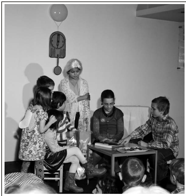
● Z vánoční hry ●

Kázání o 1. neděli v novém roce (2) • Editorial (4) • Taize ve Vršovcích (5) • Zápis ze schůze staršovstva dne 11. 12. 2014 (6) • Ekumena: Tentokrát „u husitů“ (8) • Co pro vás připravila pražská mládež? (9) • Na stáži v Německu (11) • Báseň: Neřeším, že nehřeším (12) • I věznice může být příbytkem Božím (13) • Otevřený dopis synodní rady ČCE předsedovi Vlády ČR a ministru vnitra ČR (14) • MĚR: Soutěž a výstava (15) • Recept: Báječný perník (16)