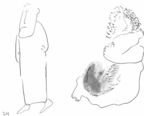
Ilustrace: Ivan Urbánek

Z knihy JOSEF, kterou je možno zakoupit v nakladatelství EMAN.